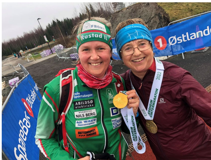
Vintermarathon på Jessheim