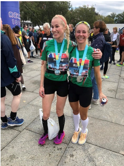
To blide damer i Oslo Marathon

Mange av Rustad IL sine medlemmer løper friidrett for klubben, de aller fleste er fra langrennsgruppa. Allsidighet er viktig, og friidrett er en fin avveksling for andre idretter også. Mange av Rustad IL sine medlemmer er også å se på friidrettsbanene på Trasop og Lambertseter for trening.